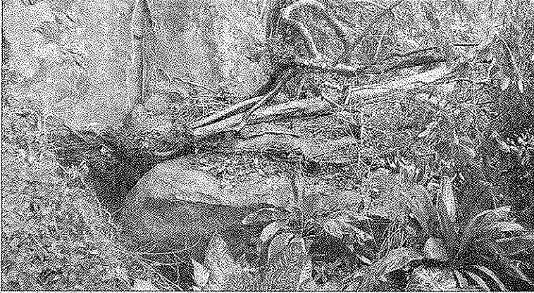
Avant sa chute, dimanche, le rocher avait été repéré et devait être extrait.

Un rocher, de la taille d'une voiture s'est détaché de la paroi montagneuse, peu avant 14 h, dimanche dernier, au lotissement Ilikai, situé au PK 29,9, à Tiama'o, à Papara (lire notre édition d'hier). Situé à près de trois mètres de hauteur d'une maison, il s'est écrasé dans la propriété, heureusement sans rouler et alors que la cour était vide.